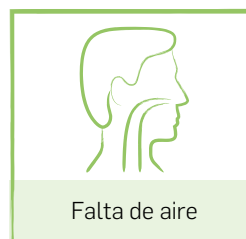
Falta de aire