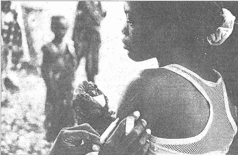
Una chica recibe una dosis de una vacuna.