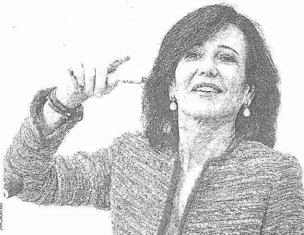
Ana Botín, presidenta de Santander.

La entidad presidida por Ana Botín comunicó durante el Día del Inversor en Lon-