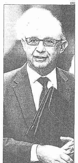
El ministro Cristóbal Montoro.

nen a mítines a la Comunitat, y es que esta tierra está infrafinanciada, diga cómo se va a afrontar esta cuestión el año que viene, pues aún está «en disposición de ponerlo en marcha todo». Para Ximo Puig, es necesario una «buena conexión» con España, que en este momento está «absolutamente deshilachada», porque los valencianos están atravesando una situación «extraordinariamente complicada» por la infrafinanciación y la infrainversión. Recordó que el Consell tiene «una hoja de ruta invariable» y es conseqüente que la Comunidad Valenciana sea atendida «con justicia» y «tratada con equidad» a través, aseguró, del espacio del «diálogo». Ximo Puig afronta el encuentro de hoy con el titular de Hacienda tras el fiasco de su reunión con Mariano Rajoy.