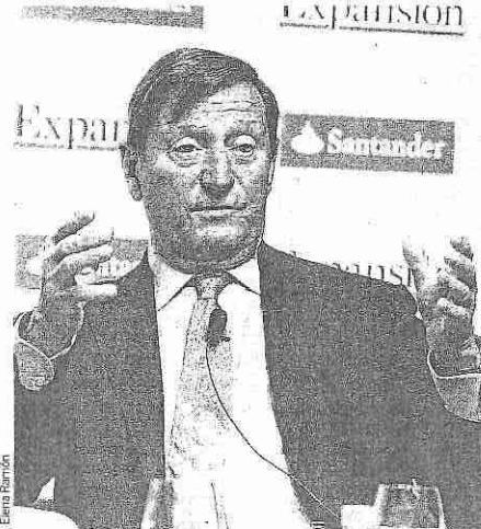
El presidente de Almirall, Jorge Gallardo.

La farmacéutica crece un 53,5% más en Estados Unidos y apenas un 0,1% en Europa