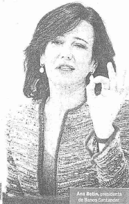
Ana Botín, presidenta de Banco Santander

En el transcurso de estos años Santander ha apostado